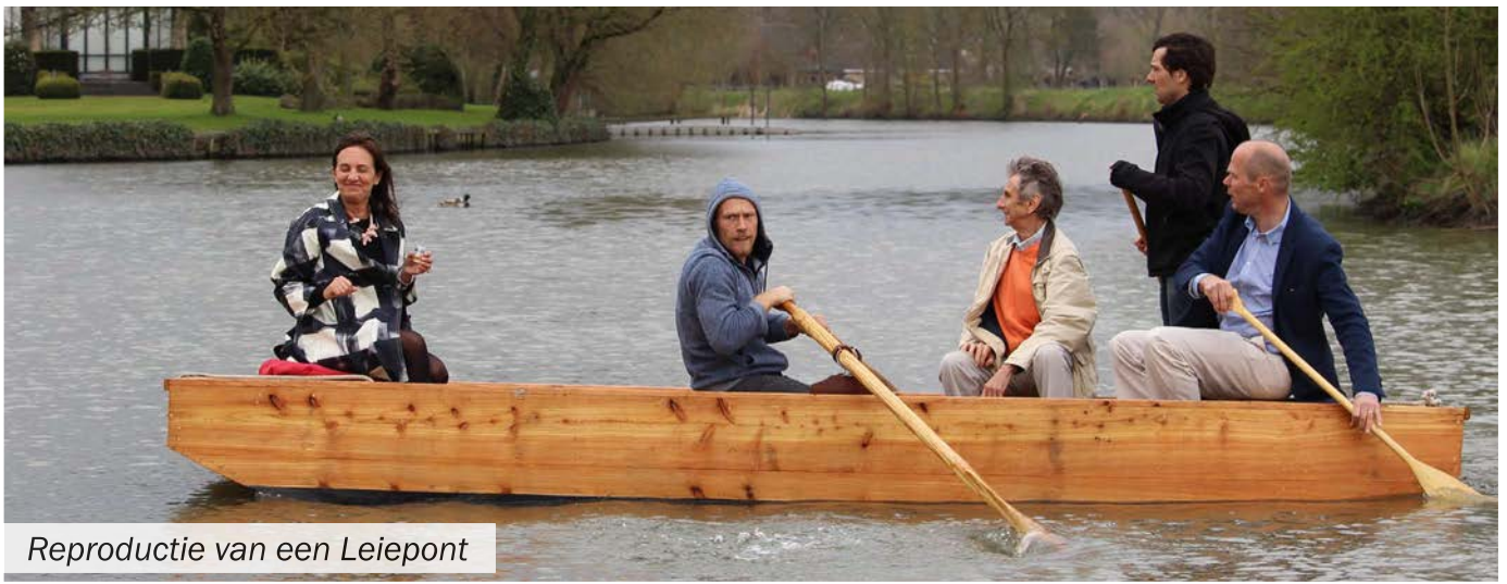
Reproductie van een Leiepont