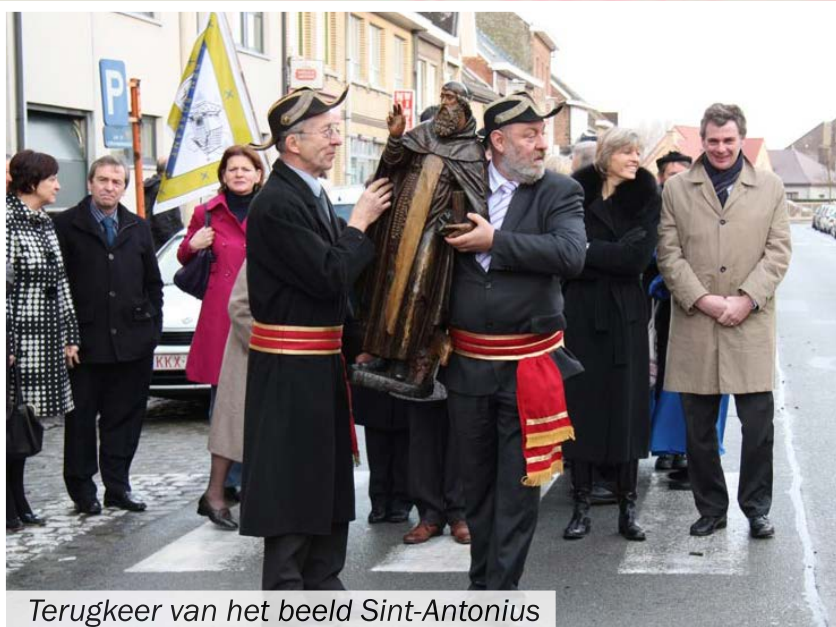
Terugkeer van het beeld Sint-Antonius

De actie bewijst dat ook lokale verenigingen met succes de nodige fondsen kunnen verzamelen voor lokaal erfgoed. Het beeld bevindt zich nu in het stedelijk museum van Aalst, waar het permanent wordt tentoongesteld. Maar elk jaar keert het beeld naar Herdersem terug, voor de duur van de Sint-Antoniusfeesten.