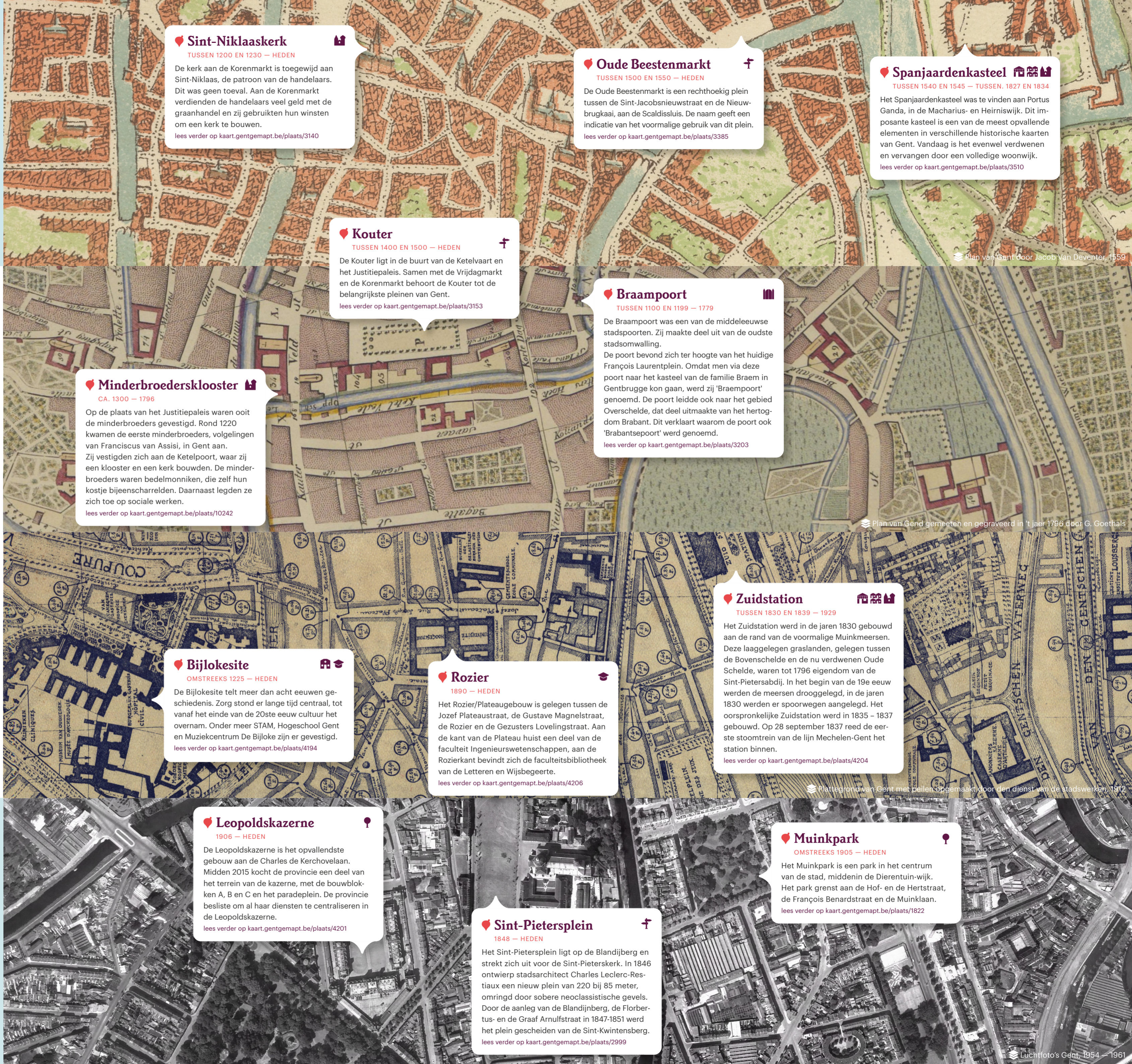
Plan van Gent door Jacob Van Deventer, 1559