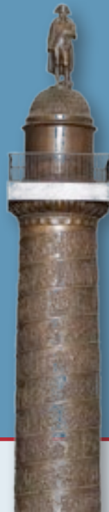
Maquette van de zuil van de Grande Armée, Place Vendôme in Parijs, 19de eeuw