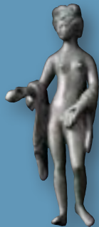
Bronzen Venus, 2de eeuw (Velzeke, België)