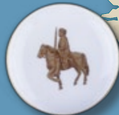
Bord met Karel de Grote, kleinzoon van Karel de Grote, 1943

Twee bloedige wereldoorlogen verscheuren Europa in de 20ste eeuw. De frontlinie van de Grote Oorlog lijkt verdacht sterk op de breuklijn die ontstond na de splitsing van het rijk van Karel de Grote. Geschiedenis is nooit toeval. Een paar decennia later maken fascistische regimes kwistig gebruik van symbolen uit het Europese verleden.