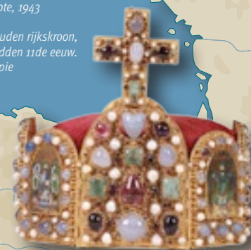
Gouden rijkskroon, midden 11de eeuw. Kopie