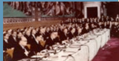
De ondertekening van het Verdrag van Rome, 1957

Kunstenaren geven hun mening. Ook u wordt aangezet om na te denken over het vroegere, hedendaagse én vooral toekomstige Europa.