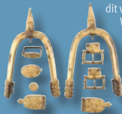
Vergulde Karolingische ruitersporen en gouden Byzantijnse munt, 9de eeuw (Biskupija, Kroatië)