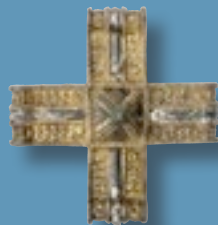
Vergulde bronzen beugel (Gradišče boven Bašelj, Slovenië)