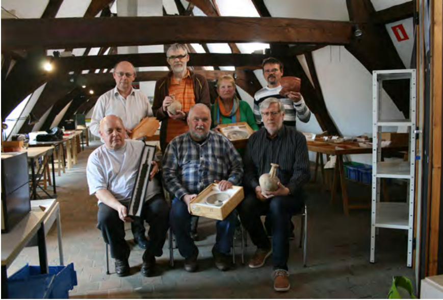
De werkgroep archeologie op de museumzolder.

Gent naar het Stadsmuseum Aalst te verhuizen. Inmiddels zijn er ook contacten gelegd met Leuven. In de universiteit en het toenmalige museum Vanderkelen ligt nog materiaal dat de vrijwilligers mogen fotograferen en inventariseren.