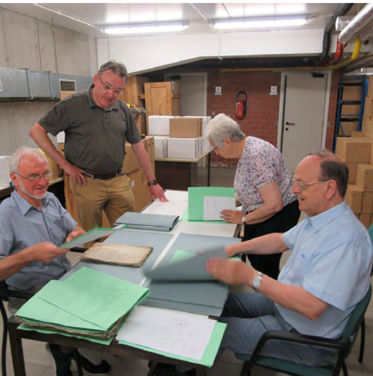
Elke maandag trekken de vrijwilligers van de Heemkundige Kring Ten Mandere naar de kelderruimte van het gemeentehuis om het historisch archief te ordenen.