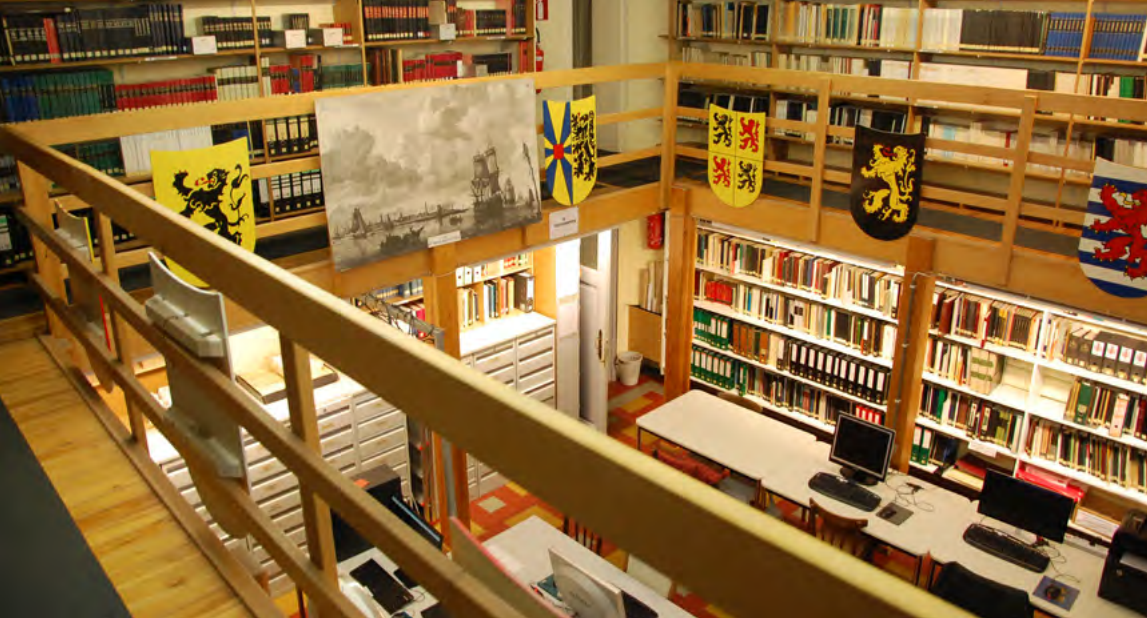
Het omvangrijke documentatiecentrum van Familiekunde Oostende.

persoon meer dan 100.000 namen foutloos in. Dankzij hem is de hele volkstelling van 1815 in West-Vlaanderen nu publiek raadpleegbaar via een en dezelfde databank.