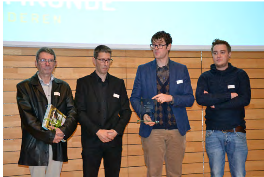
De jongeren van de werkgroep Balen Bevrijd op de uitreiking van de Ambassadeur Heemkunde Vandaag 2015 (de eerste, tweede en derde van rechts).