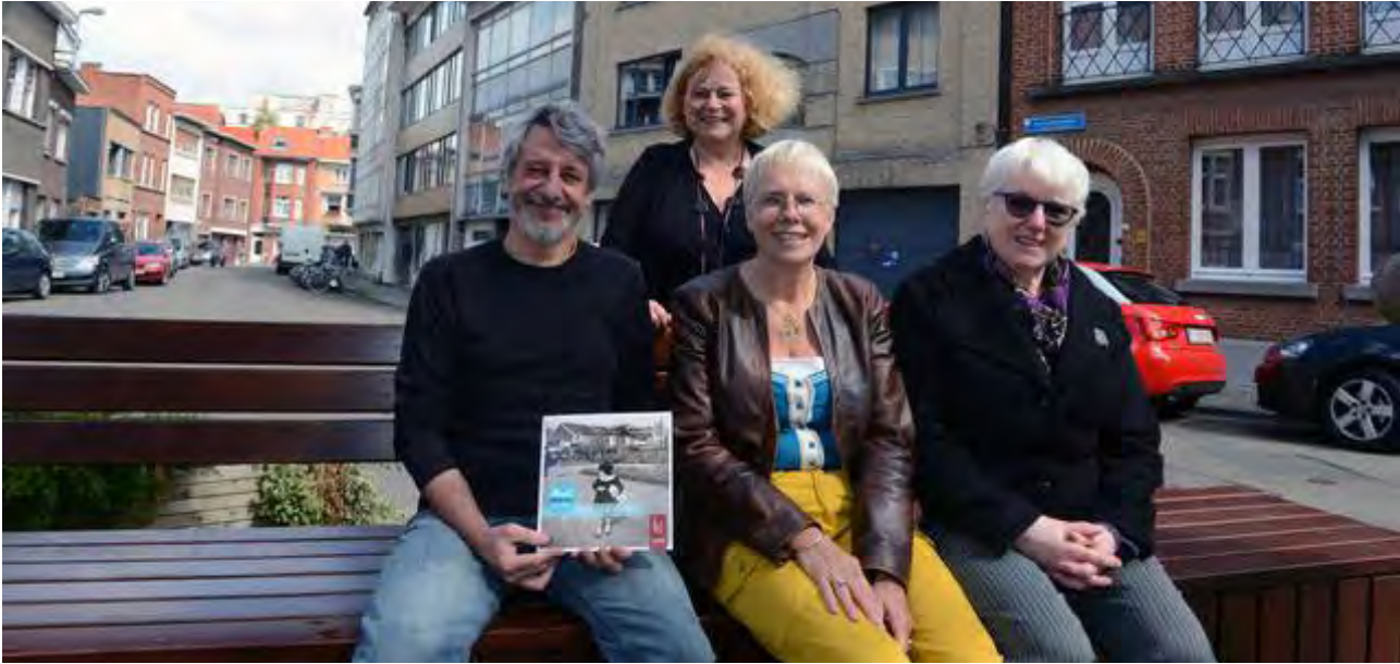
Buurtbewoners van de wijk 'Nieuw Kwartier' en de schepen van Cultuur presenteren een nieuwe bijdrage in 'Straathistoires'.