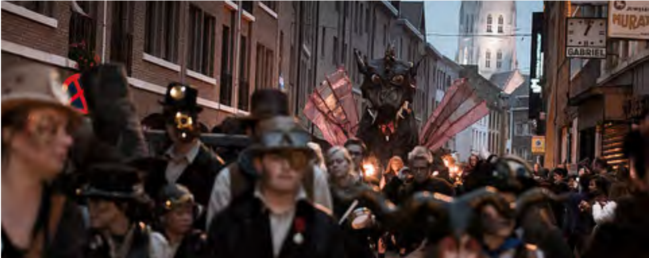
De Kweikersparade met de draak Oswaldus op de achtergrond.

Kweikersdag een heuse feestdag in het leven. Ze kozen voor 10 oktober, niet toevallig de 'tien'-de dag van de 'tien'-de maand. OpgewekTienen en het stadsbestuur zetten dan telkens een andere wijk in de kijker. In 2015 was het een speciale feestdag, want dat jaar vierde Tienen ook duizend jaar stadsrechten. Daarom organiseerden opgewekTienen, de dienst Toerisme en Erfgoed en tientallen lokale organisaties een 'Kweikersparade' die 10.000 toeschouwers trok. Met deze parade wilden de initiatiefnemers een oude traditie laten herleven in Tienen, want al in de 16e eeuw werden op regelmatige tijdstippen stoeten georganiseerd. Op de nieuwe parade konden de gerestaureerde