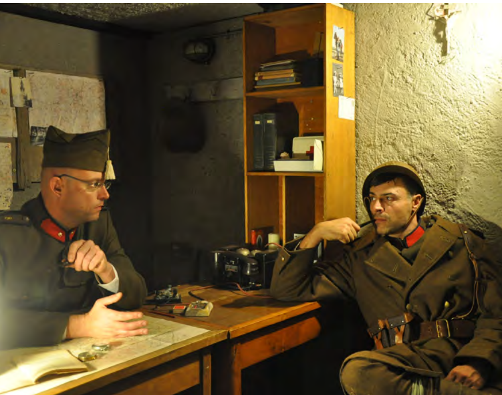
Gedurende twee speelseizoenen liepen er zo'n 80 voorstellingen. In totaal kwamen zo'n 1.760 mensen naar Ik was 19 in '14 kijken.

Aalsters Stedelijk Museum Oud Hospitaal en in het najaar van 2016 werd het omgevormd tot een radioluisterspel bij Radio Katanga, een lokale zender in Aalst.