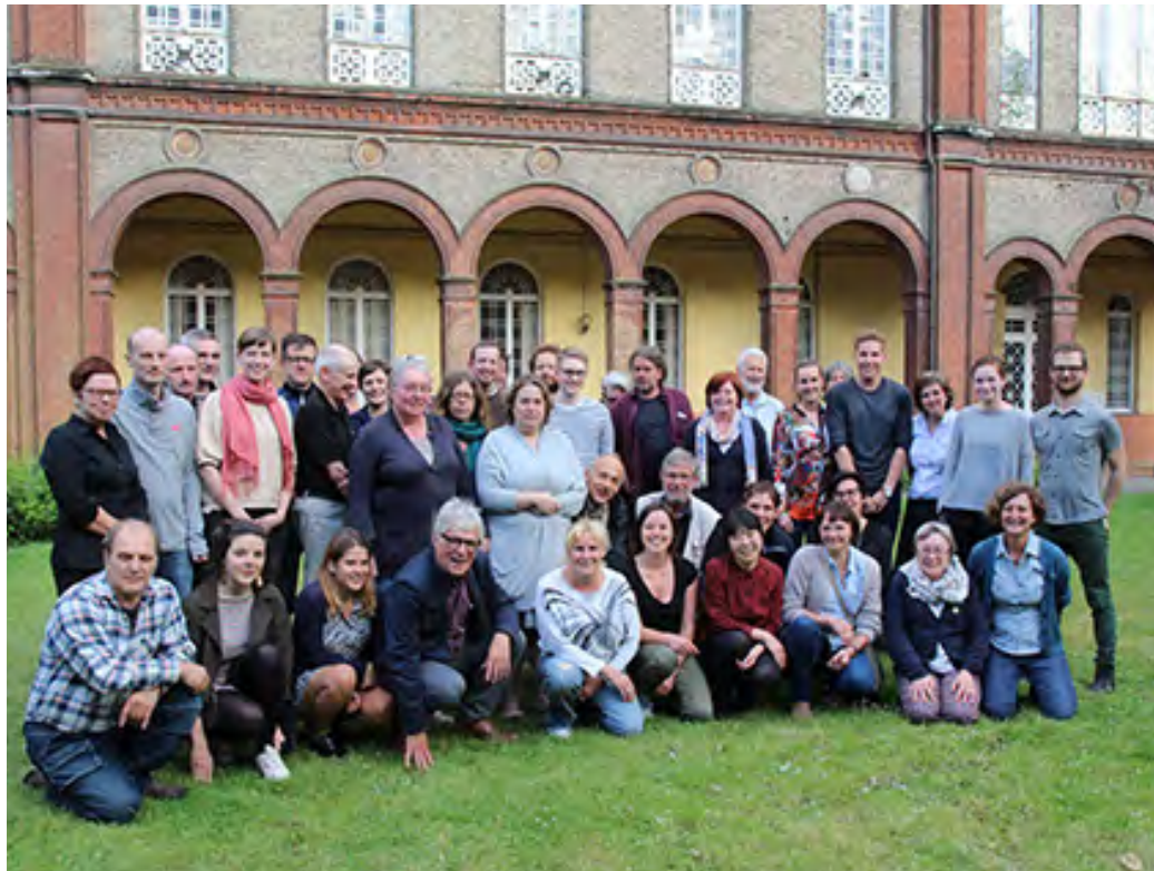
De vrijwilligers en de staf van Museum Dr. Guislain.

Het museum investeert in een vergaande individuele begeleiding. Dat vraagt veel, maar het rendeert ook. Want vele vrijwilligers ervaren, dankzij het vrijwilligerswerk, een positieve wending in hun leven. Zo zijn er vrijwilligers die bijvoorbeeld door een hersenletsel of een psychisch probleem niet meer