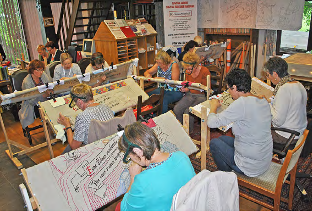
Borduursters aan het werk in Assenede.