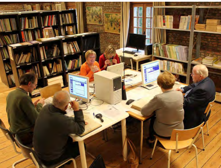
Vrijwilligers aan het werk in de Abdijbibliotheek in Bornem