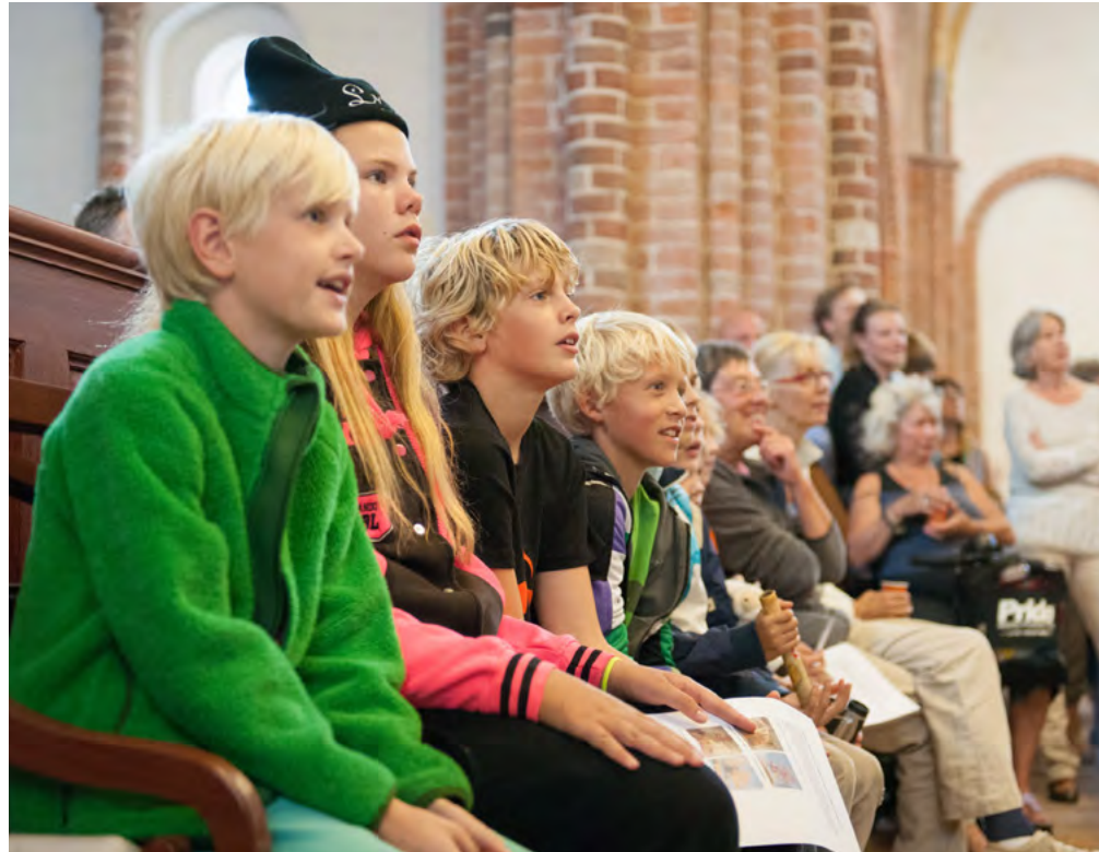
Stichting Oude Groninger Kerken vergroot het draagvlak voor de Groningse kerken, ook bij de jeugd.

Het hoofdkantoor van de stichting neemt de bouwkundige en renovatiezorg op zich. Alle activiteiten om de kerk 'levend' te houden daarentegen nemen de vrijwilligers op. Door de vergrijzing en ontvolking op het platteland kan het voor