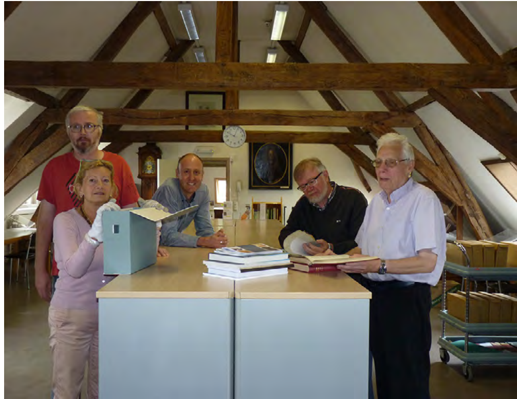
Enkele vrijwilligers van het Stadsarchief Mechelen.

Ook op andere manieren houdt het stadsarchief de vrijwilligers gemotiveerd. Zo werken ze vaak per twee. “Dit ‘duowerk’ brengt mensen letterlijk dichterbij elkaar. En uiteraard investeert het stadsarchief ook in een gezonde groepssfeer. Vrijwilligerswerk is in de eerste plaats een fijne tijdsbesteding. We gaan op teamuitstap met de hele ploeg; dus zowel met de betaalde krachten als met de vrijwilligers. We maken altijd de combinatie van een ‘serieuzer’ deel,