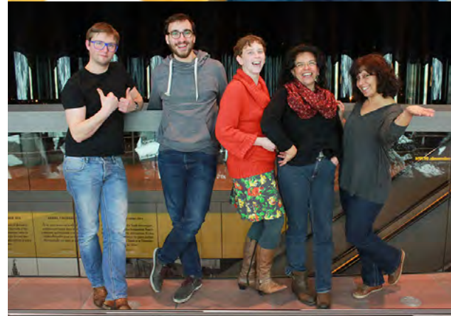
Ook in zijn vrijwilligerswerking wil het MAS de diversiteit van de stad weerspiegelen