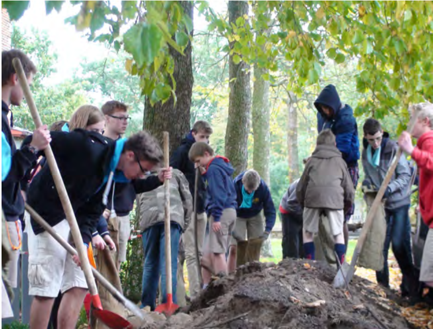
Jongeren zetten zich actief in voor 100 jaar WOI.

vertelt Kris. “Zo gingen ze alleen op stap tijdens de meerdaagse tocht naar de Westhoek. Toen ze terugkwamen liepen ze over van enthousiasme”. Het enthousiasme van deze kleine groep bleek een succesfactor, want het sloeg over. Deze jongeren waren ook telkens aanwezig op de vergaderingen met de jeugdbewegingen. “Als jongeren elkaar aanspreken en iets vragen, is dat toch iets anders dan wanneer volwassenen dat doen.”