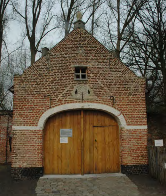
Feestelijke opening van het gerestaureerde pesthuisje, met Jo Lommelen in het midden.