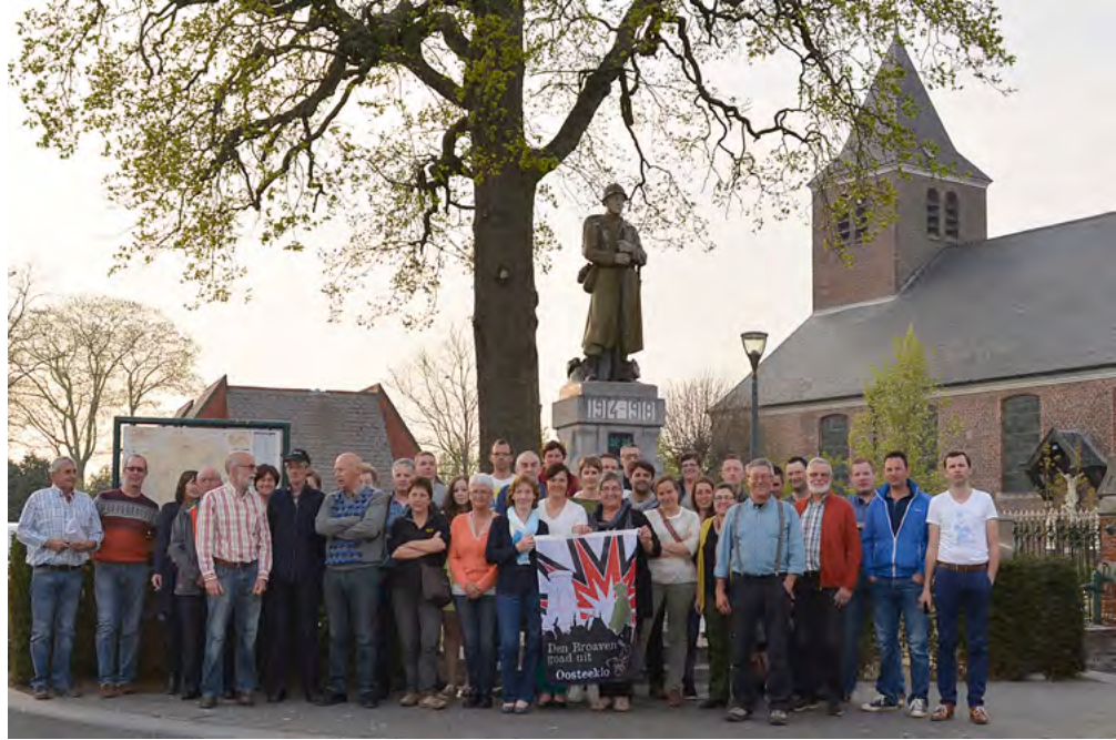
De herbergiers voor het standbeeld van 'Den Broaven'.

Vanzelfsprekend vroeg zo'n groot project een goede voorbereiding. De heemkundige kring richtte eerst een stuurgroep op. Die bestond uit vier bestuursleden. Twee leden waren lid van de Orde van de Smoutpot, een bevriende vereniging die oude culinaire tradities wil laten herleven. Deze vier stuurgroepleden stuurden het hele evenement aan: ze dachten eerst een scenario uit en legden de lijnen vast voor het project. Voor de stuurgroep was het bijvoorbeeld belangrijk dat het plaatje historisch klopte. Zo was het bijvoorbeeld niet de bedoeling dat de herbergen Coca-