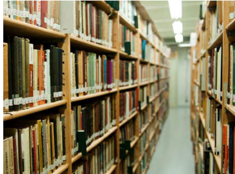
De bibliotheek van het FOMU.