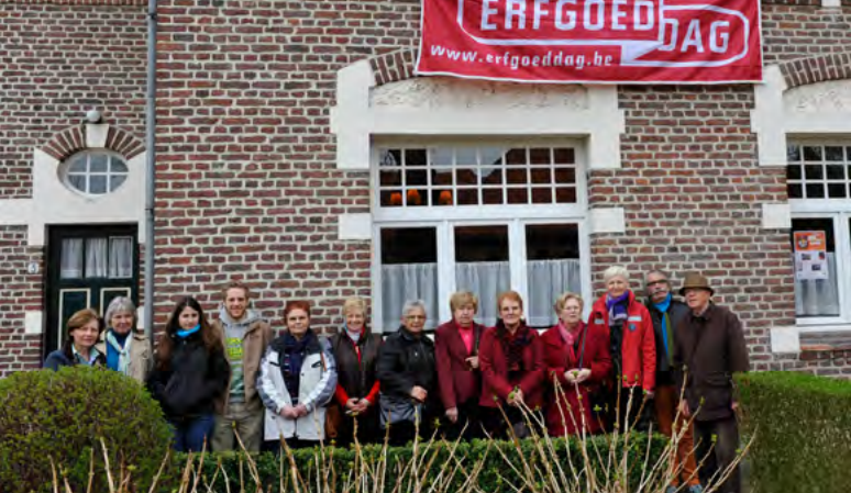
Stichting Erfgoed Eisden is vrijwel altijd van de partij tijdens Erfgoeddag.