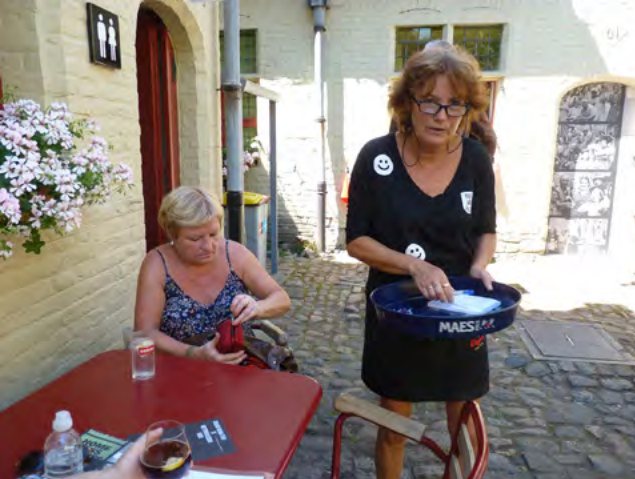
De Vrienden houden het museumcafé open tijdens de Gentse Feesten.