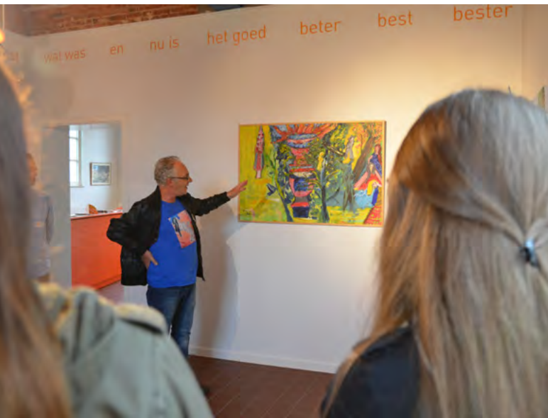
Het bezoekerscentrum 'Pas-Sage' wil het stigma over psychiatrie doorbreken.