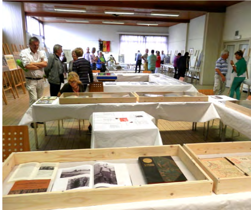
Heemkring 't Oude Grimbiaca komt geregeld naar buiten met tentoonstellingen.

Alle vrijwilligers worden verzocht de doelstellingen van de kring te onderschrijven. Iedereen engageert zich om kennis en inzichten te delen met anderen. Je mag dit zelfs heel letterlijk nemen. Wie geen informatie of kennis wil delen, kan enkel als logistieke