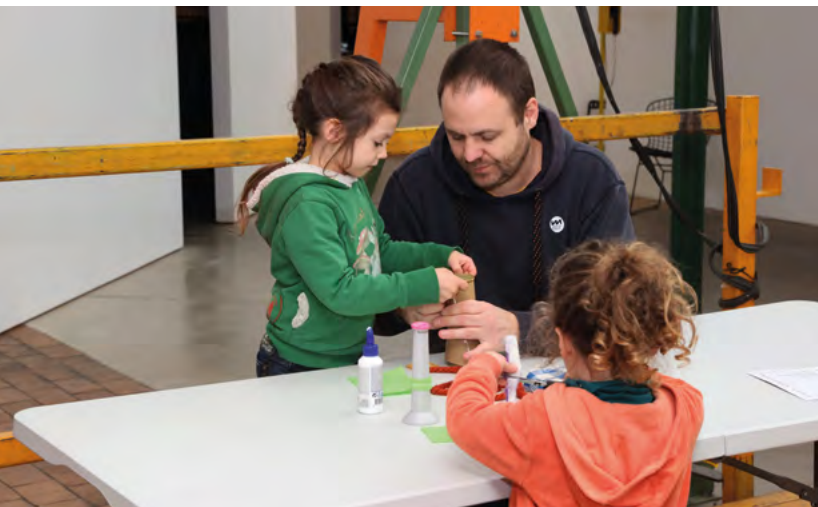
↑ © Krokusriebels, fotograaf: Kristof Ghyselincx

In andere initiatieven werkten kinderen, tieners of jongeren mee aan een audiotour of een tour in de ErfgoedApp, leidden ze bezoekers rond of maakten ze mee een tentoonstelling ... U kan jongeren apart werven via bijvoorbeeld een oproep, of samenwerken met een bestaande jongerenwerking, zoals Erfgoedcel Leuven deed met jongerenwerking MIJNLEUVEN. Het aanbod dat zo tot stand komt, is niet per se altijd alleen bedoeld voor kinderen of jongeren; ook andere mensen kunnen er vaak van meegenieten.