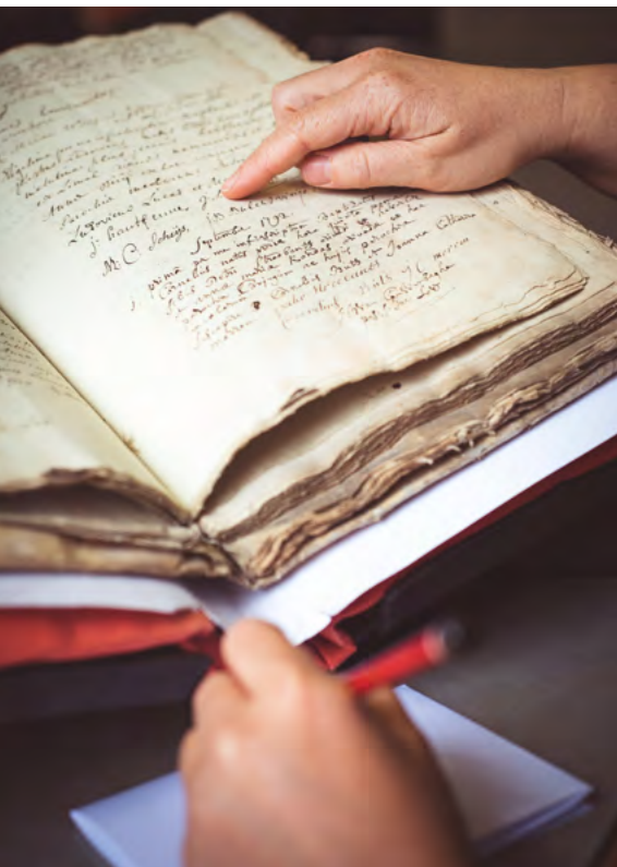
↑ Project MamaMito