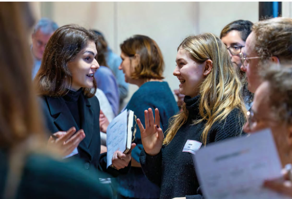
↑ Erfgoedweken 2023, Vorming Kickoff Erfgoedklasbakken