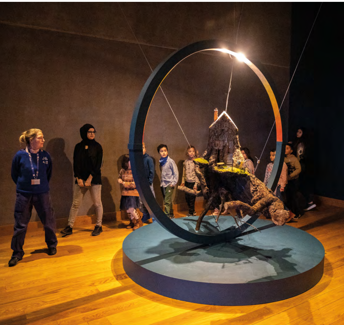
↑ Installatie Philippe Van de Velde, scenograaf Studio ORKA