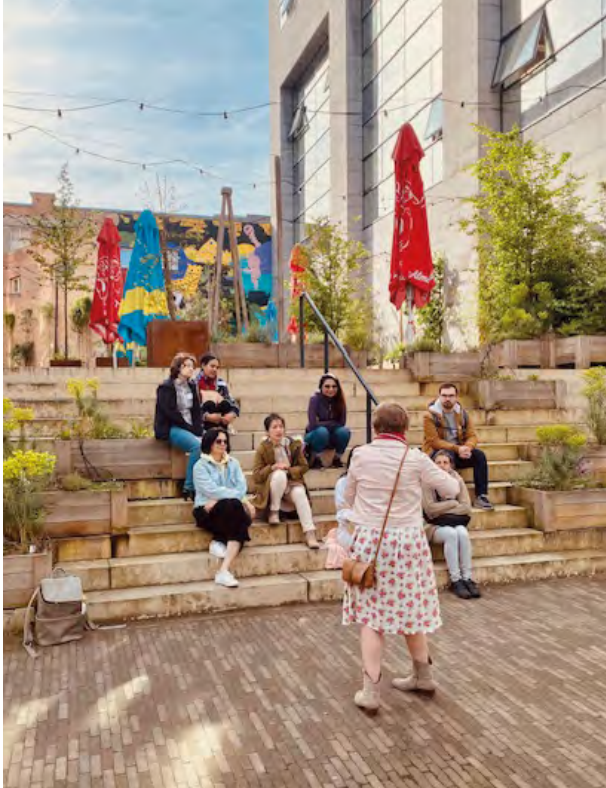
↑ Verhalen lezen en beluisteren (CLT)